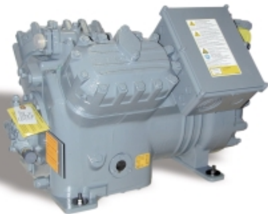
Компрессор серии Discus 20 л.с.

Компрессорно-конденсаторные агрегаты с полугерметичными компрессорами